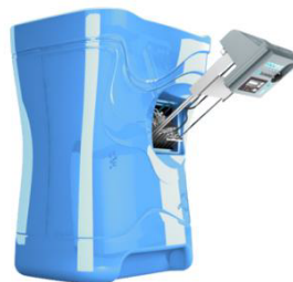
PERFORMANCE DE NETTOYAGE