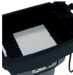
Table de nettoyage ergonomique.