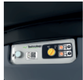
Boîtier électromécanique démontable sans outils.