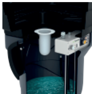
Filtration chaussette 50µm.